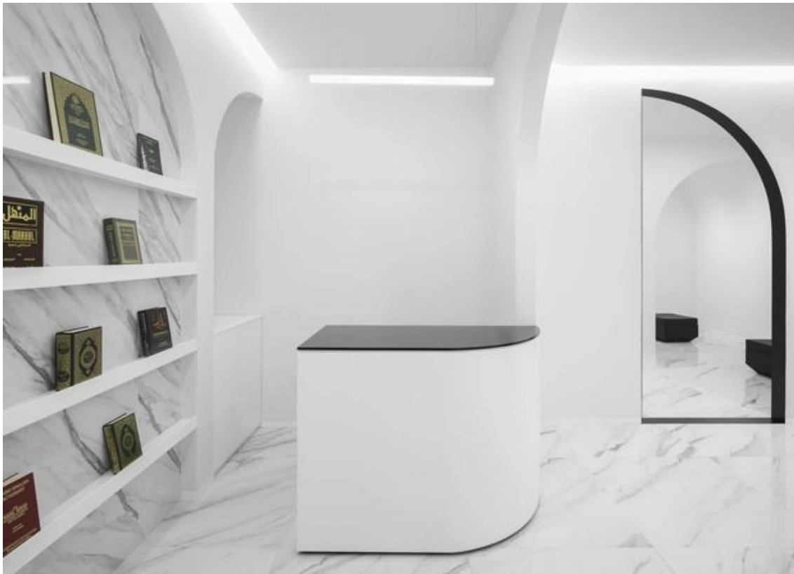
Рис. 1. Исламский культурный центр в Португалии