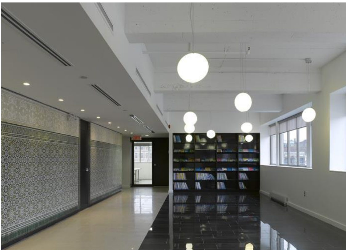
Рис. 5. Центр культуры Марокко в Монреале