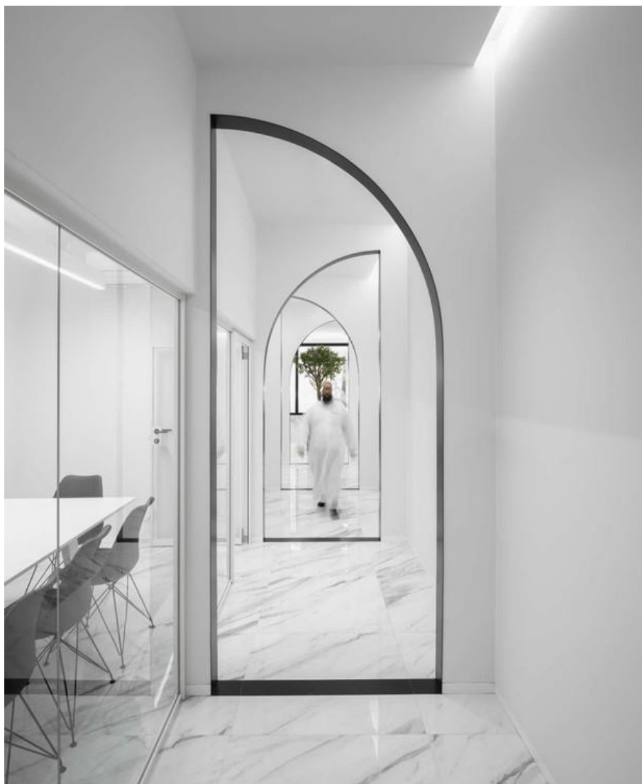
Рис. 4. Исламский культурный центр в Португалии

Дизайнерам удалось создать пространство с минималистичными черно-белыми интерьерами, в которых актуальные тренды западного дизайна сочетаются с традиционными арабскими мотивами.