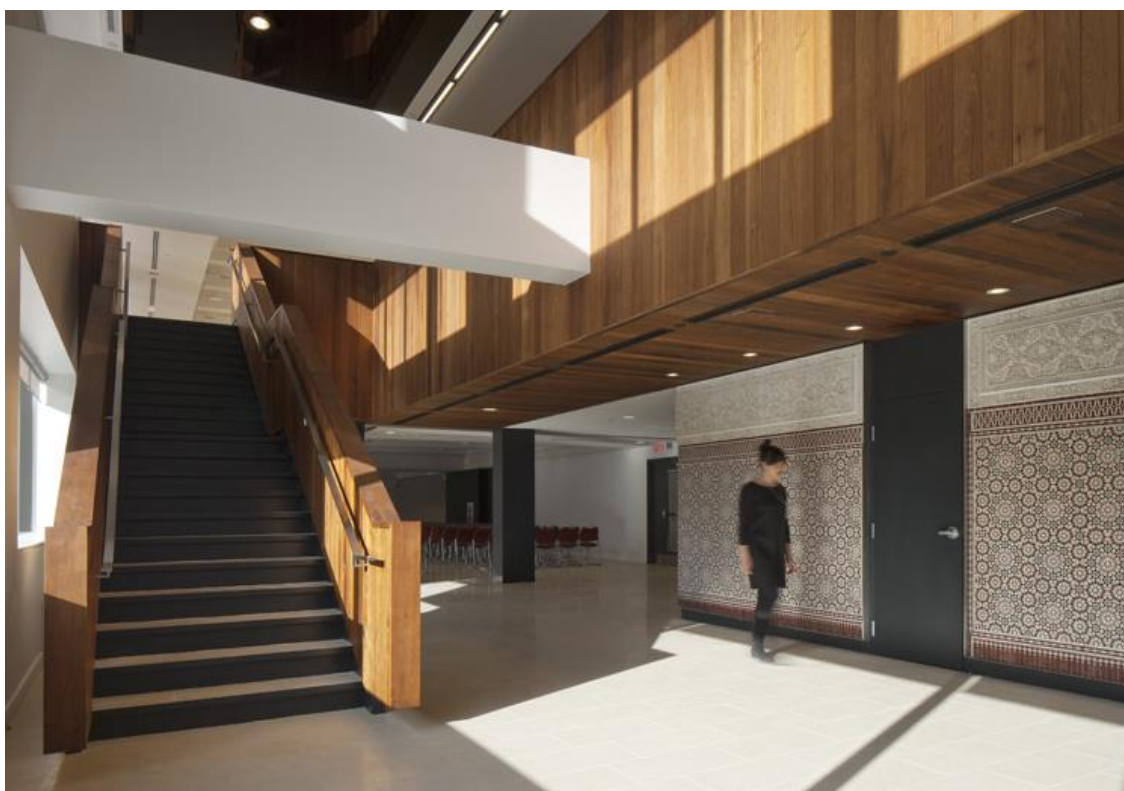
Рис. 6. Центр культуры Марокко в Монреале