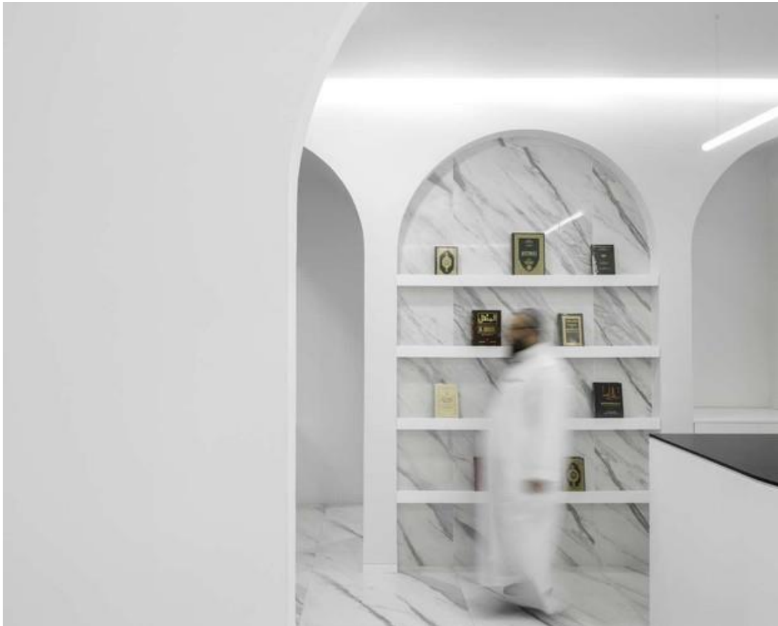
Рис. 2. Исламский культурный центр в Португалии

Пространство планировалось не только как центр духовного развития, но и место для активного общения, социальных инициатив и