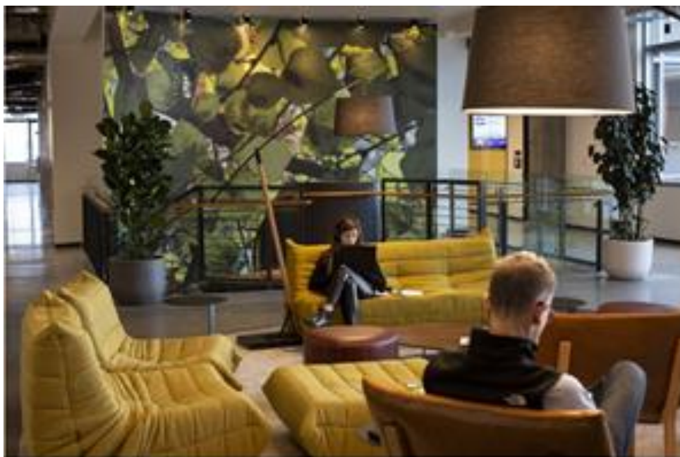
Концепция биофилии позволяет быть ближе к природе (рис. 3)

К примеру, в хорошую погоду большие раздвижные двери офиса открываются, превращая внутренний коридор нового здания в просторную зону отдыха. Кроме того, по периметру кампуса, раскинувшегося на территории в 162 тыс. кв. м, проложены дорожки для ходьбы пешком и езды на велосипеде. Компания установила там около двух десятков точек доступа Wi-Fi, спрятанных в искусственных камнях из стекловолокна, поэтому сотрудники могут работать как на большой лужайке, так и возле костровых ям.