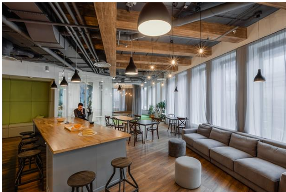
Применение искусственных деревянных балок в интерьере кафетерия (рис. 5)

Определенной инновацией было создание искусственных деревянных балок в зоне кафетерия (применение деревянных конструкций было заблокировано владельцем здания). Искусственные балки сделаны из ГКЛ и покрыты декоративной штукатуркой, удивительно точно имитирующей дерево. (рис. 5)