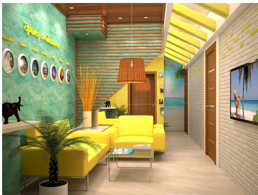
Пример дизайна турагентства «Время отдыхать» (рис. 1)

Так как главное направление деятельности данной категории компаний — это организация отдыха в разных странах для своих клиентов, в качестве основной идеи в данном случае может стать тематика путешествий. (рис. 1) [1]