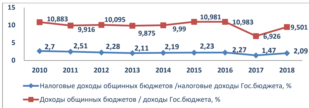
Рис. 1. Величина основных характеристик уровня децентрализации в РА