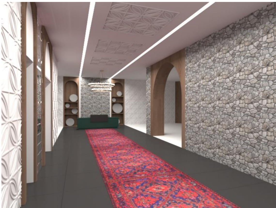
Рис. 6. Ресепшен

Применение их в качестве отделочных материалов добавит самобытность интерьеру.