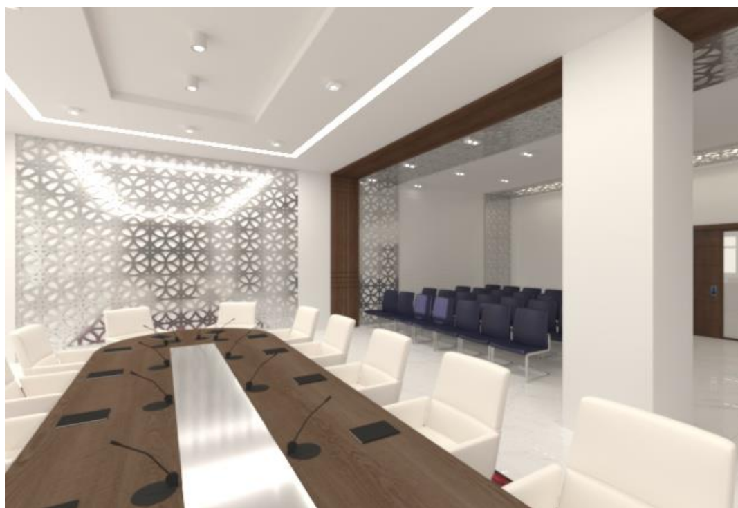
Рис. 7. Конференц зал

Например, в качестве напольной плитки с изображением орнамента; в качестве прозрачных перегородок; в качестве 3д панелей на стенах и потолке; в качестве декора мебели