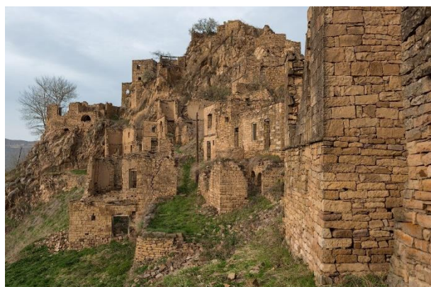
Рис. 5. Зброшенний аул Гамсутль