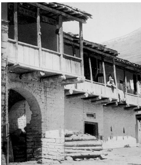
Рис.2. Традиционное жилище лезгинов