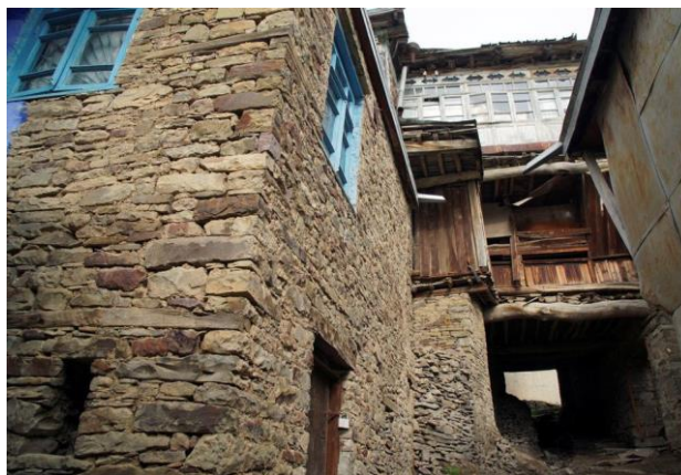
Рис. 4. Дом в селе Кубачи

Природный камень и дерево являлись основными строительными материалами у горцев.