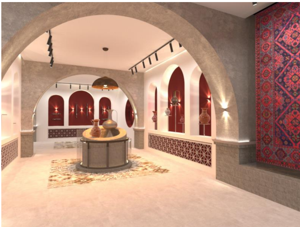
Рис. 3. Музей

2. Использование в качестве отделки интерьера традиционные материалы строительства.