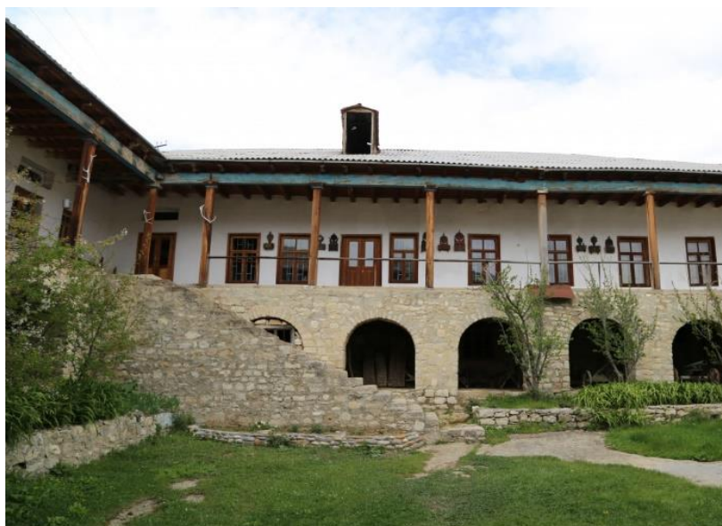
Рис.3. Хунзахский музей

Это дает основание, что арка является элементом традиционной архитектуры. В интерьере ее можно использовать уже не в качестве конструктивного элемента, а, например, в качестве