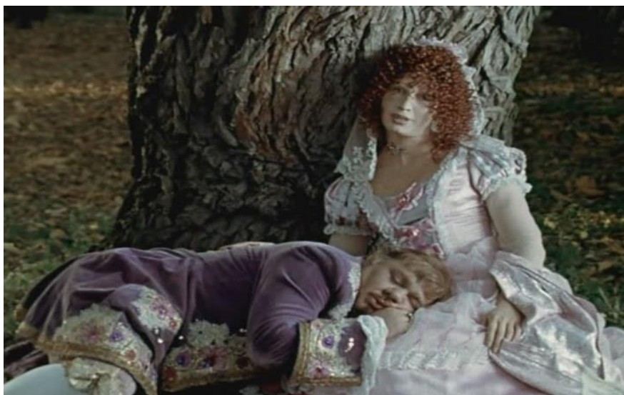
Татьяна Васильева и Евгений Леонов в фильме «Дуня».