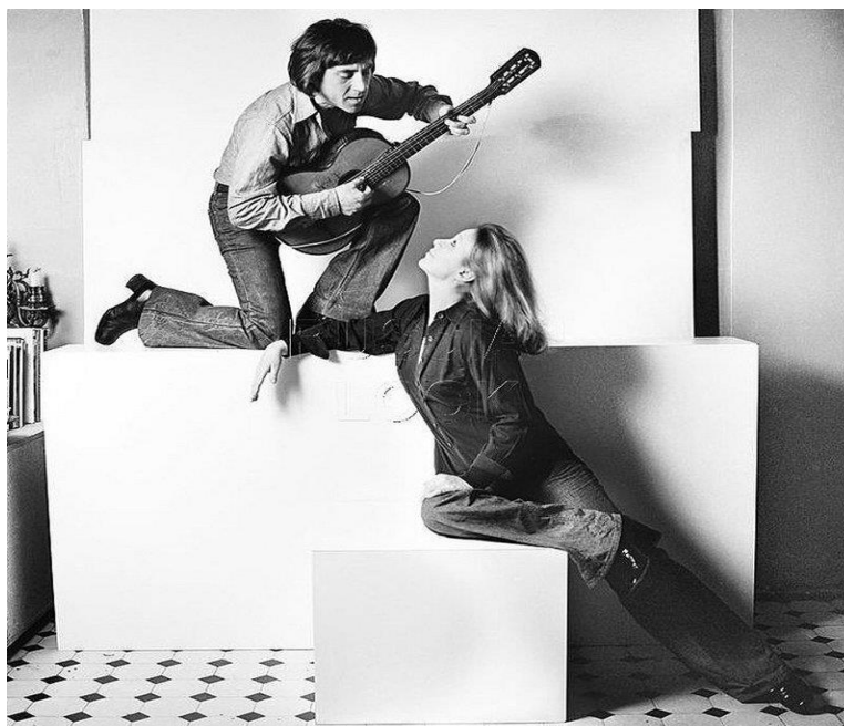
Владимир Высоцкий и Марина Влади.