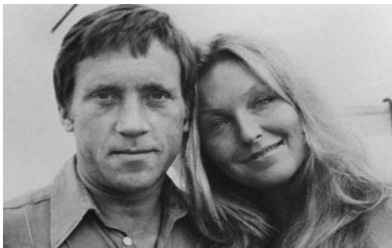
Владимир Высоцкий и Марина Влади.