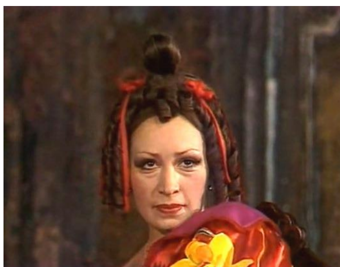
Татьяна Васильева в спектакле «Ревизор».