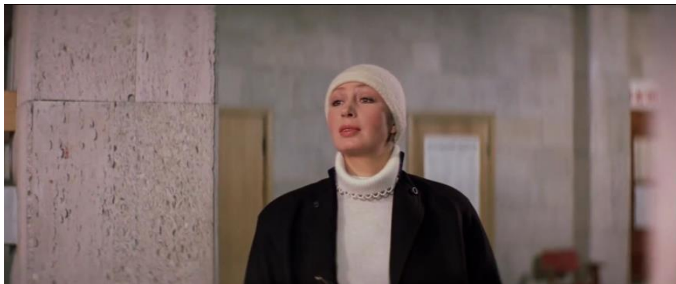
Татьяна Васильева в фильме «Самая обаятельная и привлекательная».

Оставшись одна, Алина решила прогуляться по центру и пошла на Театральную площадь. Было ещё только начало седьмого. Вечерняя многолюдная Москва манила воображение силуэтами шуб, дублёнок, пальто и курток; обрывками фраз, внезапно мелькнувшим в толпе лицом; спокойным, уютным светом жилых окон, нарядно-зазывными огнями кинотеатров, магазинов и ресторанов. Девушка любила иногда вот так побыть среди людей, одновременно