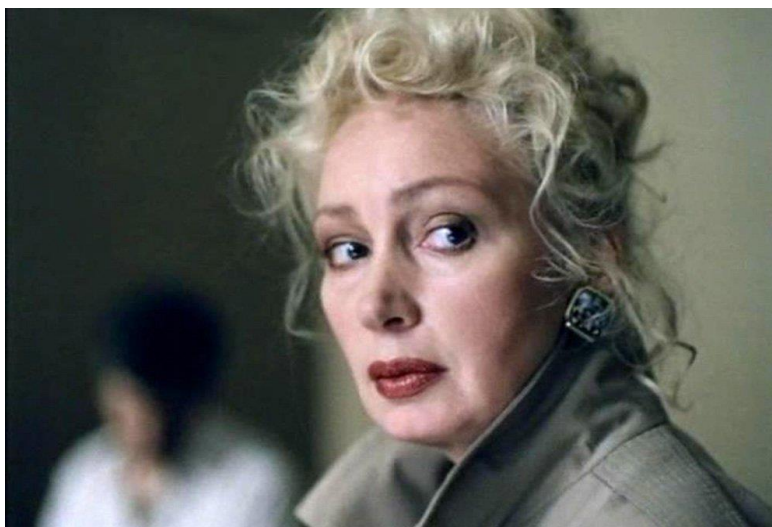
Народная артистка Российской Федерации Татьяна Васильева.