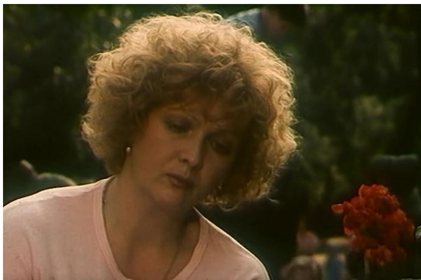
Наталья Гундарева, любимица миллионов, в фильме «Аэлита, не приставай к мужчинам».