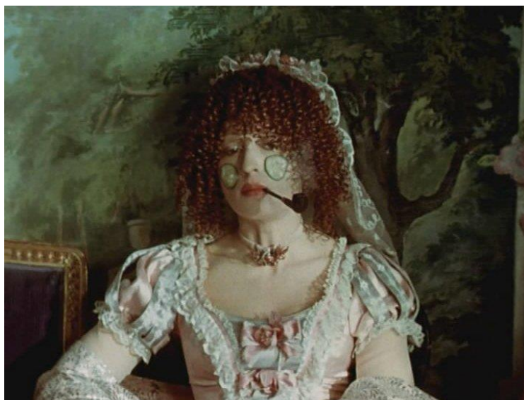
Татьяна Васильева в фильме «Дуня».