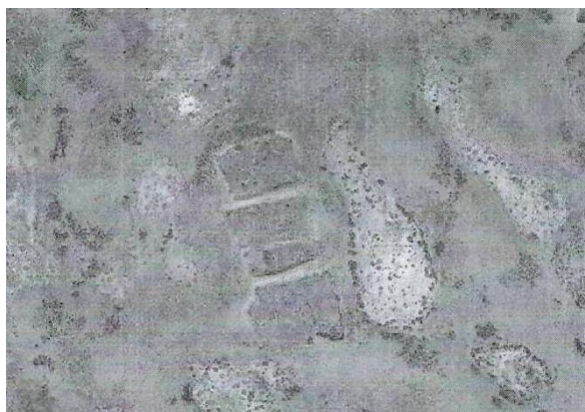
Фото 19. Неизвестное городище № 5.

Далее путь следовал вдоль русла Ортасу через перешеек, разделяющий озеро Балхаш на две части, в долину реки Токрау, где проживали кимацкие племена. При просмотре спутниковых снимков, мною было выявлено еще одно неизвестное полуразрушенное городище № 5, построенное очевидно кимаками (Фото 19, географические координаты 46°45'53"N, 75°28'42"E). Оно находится в 40 км на северо-восток от описанного выше неизвестного городища на южном берегу озера Балхаш.