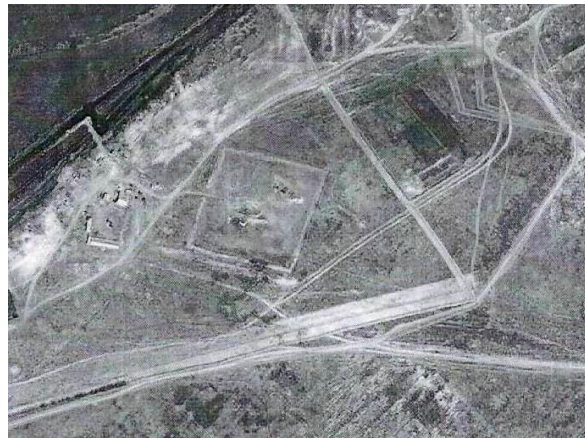
Фото 20. Неизвестное городище № 6.

Неизвестное городище, расположенное возле поселка Актогай и по своей форме напоминает городища, находящиеся вдоль выше описанного ответвления Шелкового пути от поселка Акший до городища Бояулы. В плане это четырехугольная площадка размером 140x150 м, ориентированная углами по сторонам света и окруженная оплывшим валом. Въезд в городище в середине вала с северо-западной стороны. Так как расстояние между торткулем Жаксылык и неизвестным городищем равнялось 80 километрам, то для временной остановки проходящих караванов использовались стационарные жилища-зимовки, где проживали местные земледельцы и скотоводы. Большая часть этих стоянок располагалась в интервале около 40 км между городищами, возле небольших русел мелких рек, впадавших в реку Или (географические координаты одного из них 44°01'03"N, 76°53'38"E), вдоль которых по спутниковым снимкам просматриваются караванные дороги и тропы. Далее путь этого ответвления Шелкового пути от неизвестного городища, следовал по левому берегу долины реки Или, соединяясь с маршрутом первого ответвления, шедшим к городищам Бояулы, Актам, Агашаяк, Карамерген и неизвестному (Горгуз) на берегу озера Балхаш.