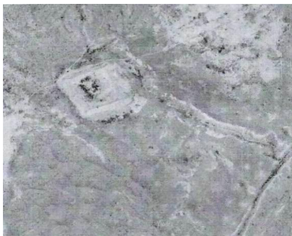
Фото 17. Древнее городище Карамерген.

городища археологами найдена керамика, датируемая VIII-XIII вв., а также медный шлак, свидетельствующий о развитии меднолитейного производства на его территории [4]. В тюрское время городище Карамерген вероятно представляло собой площадку размером 115x120 метров, огражденной земляным валом. После прихода огузов оно было перестроено в городище-крепость. На ранее насыпанных тюрками валах, огузами были возведены оборонительные глинобитные стены с башнями, для защиты от нападений враждующих кимакских и карлукских племен. В 2014 году городище Карамерген вошло в список Всемирного наследия ЮНЕСКО в Казахстане.