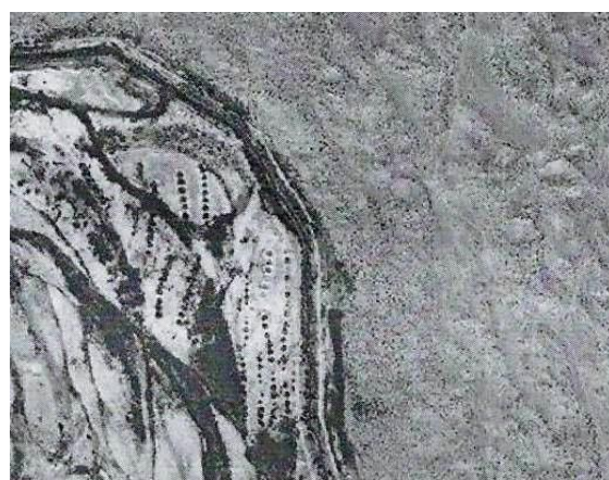
Фото 6. Поселение № 8.

- вдоль русла реки Или поселение № 7 состоящее из 100 землянок (Фото 6, географические координаты 44°38'44"N, 76°33'00"E);