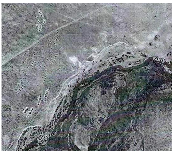
Фото 7. Поселение № 8.

- на юге пустыни Таукум на левом берегу реки Курты поселение № 8 состоящее из 260 землянок (Фото 7, географические координаты 44°11'11"N, 76°31'56"E).