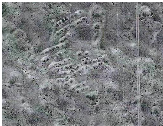
Фото 5. Поселение № 7.

- вдоль русла реки Или поселение № 7 состоящее из 100 землянок (Фото 6, географические координаты 44°38'44"N, 76°33'00"E);