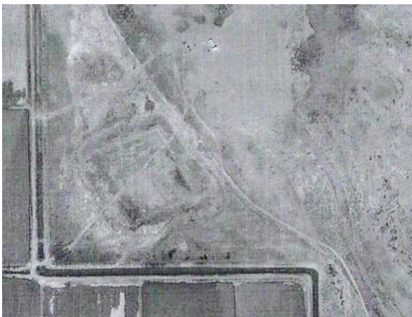
№ 3. Фото 14. Древнее городище Бояулы.

Из описываемого караван-сарая дальше караванный путь проходил вдоль правого берега долины реки Или к городищу Бояулы, получившее своё название от урочища Бояулы, которое в то время, находилось в центре долины, на левом берегу одного из русел, в 20 км к северу от поселка Баканас (Фото 14, географические координаты 44°55'22"N, 76°07'39"E). Первые исследовательские работы этого городища проводились в 1962 году Семереченской археологической экспедицией под руководством