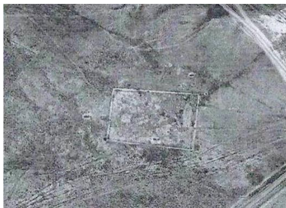
Фото 9. Неизвестное поселение у поселка Казахстан.

насыпными оплывшими валами. Внутри них встречаются остатки стен квадратных жилых помещений с глинобитных стен. Одно из выявленных сооружений находится в 400 метрах на восток от современного поселка Казахстан (Фото 9, географические координаты 44°16'27"N, 76°42'43"E). Размеры его 110x160 метров. Второе находится на юго-западной окраине поселка Ушорал (географические координаты 44°14'01"N, 76°50'53"E). Планировка его схожа с предыдущим сооружением и имеет размеры 110x120 метров. В настоящее время оно сильно разрушено и повреждено поселковыми дорогами. На восток от поселка Ушорал находятся еще два небольших сооружения размером 70x70 метров (географические координаты 44°14'01"N, 76°50'05"E; 44°13'54"N, 76°49'37"E), а на юго-восток три. Первые два имеют аналогичные размеры (географические координаты 44°13'18"N, 76°51'54"E; 44°12'50"N, 76°51'55"E), третьи чуть больше – 90x90 метров и очень разрушенное водными потоками реки Или при наводнениях (географические координаты 44°10'32"N, 76°54'20"E).