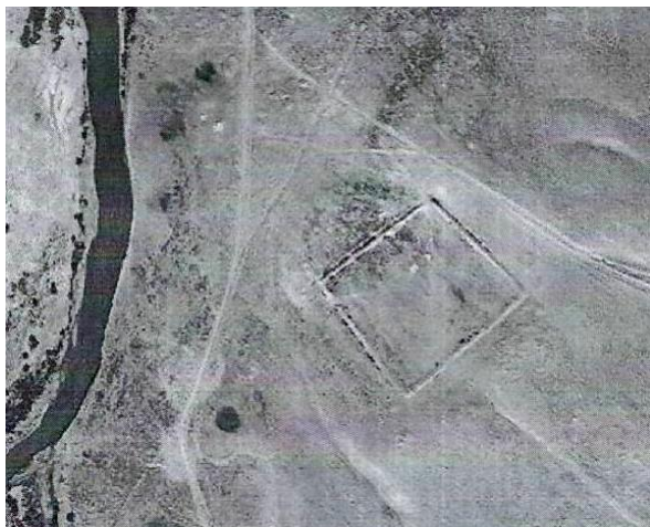
Фото 11. Неизвестное поселение-торткуль № 1.