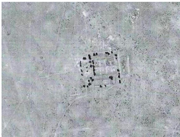
Фото 13. Неизвестный караван-сарая

44°48'02"N, 76°19'34"E). Данный караван-сарай расположен в 30 км на север от второго неизвестного поселения-торткуля среди песков и в 2,5 км восточнее современного поселка Баканас. Он был открытого вида, площадью 150x170 метров и представлял собой комплекс с десяти хозяйственных дворов квадратной и прямоугольной формы, где находились конюшни, склады и места для проживания. Стены дворов, очевидно, были глинобитные и в настоящее время разрушенные, оплывшие и присыпаны песками пустыни. В западной части караван-сарая, отмечаются фрагменты магистрального канала, который был проложен от одного из русел реки Или и служившего в то время, для подачи воды на его территорию.