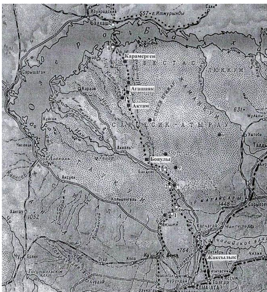
Рис. 1. Карта древней дельты реки Или с поселениями, городищами и маршрутами движения караванов Великого Шелкового пути.

получили небольшие остаточные соленые озера с соленостью воды до рапы и солонцы, с пластами прозрачной каменной соли. В периоды весенних паводков и поднятий уровня воды в озере, они подпитывали солью его восточную часть, повышая тем самым солоноватость вод. Южнее от прибрежной солонцово-зона, древняя дельта реки Или с поверхности была покрыта плодородным илом на глубину до 30 и более сантиметров, который в результате регулярных затоплений постоянно поновлялся и служил прекрасным удобрением для выращивания сельскохозяйственных культур. Поэтому земледелие здесь было очень продуктивным, но из-за происходивших периодических наводнений и засух, приводивших к избытку или нехватки воды, возникала потребность в проведении ирригационных работ – по осушению, орошению, возведению дамб, запруд и подводящих каналов, служивших для сбора и направления воды в нужные места. Это и послужило древней дельте р. Или еще до н.э., стать центром земледелия, кочевого и полукочевого скотоводства, охоты, рыболовства для многих проживающих здесь кочевых племен.