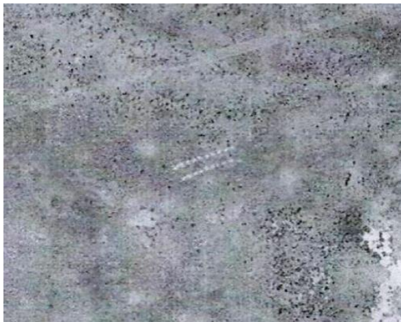
Фото 1. Поселение № 1

- среди песков между руслами Шет-Баканас и Кара-Баканас древней дельты реки Или поселение № 1 состоящее из 20 землянок (Фото 1, географические координаты 45°45'44"N, 75°33'05"E), поселение № 2 состоящее из 20 землянок (географические координаты 45°48'15"N, 75°40'14"E), поселение № 3 состоящее из 24 землянок (Фото 2, географические координаты 45°48'22"N, 75°40'35"E);