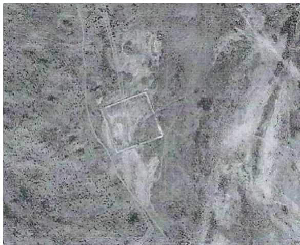
Фото 12. Неизвестное поселение-торткуль № 2.

Следующее неизвестное поселение-торткуль № 2, располагалось в 40 км на север от описанного выше неизвестного поселения-торткуля, на левой стороне долины реки Или у границы с пустыней Таукума (Фото 12, географические координаты 44°34'33"N, 76°32'03"E). Оно также представляет собой четырехугольную площадку размером 100x100 метров, окруженную оплывшим валом и ориентированным углами по сторонам света. Въезды на её территорию находятся с трех сторон от долины реки Или.