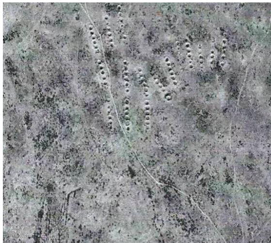
Фото 8. Поселение № 9.

В дальнейшем часть саков, проживающих вдоль реки Или и в её древней долине, стало переходить на оседлое проживание с ведением комплексного скотоводческо-земледельческого хозяйства при сохранении господствующей роли скотоводства. С помощью ирригационного земледелия, они на небольших площадях,