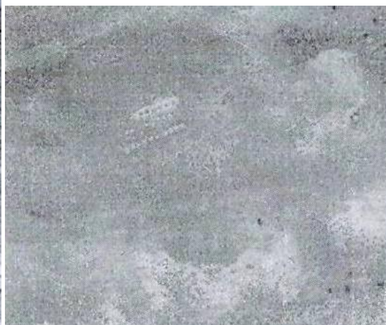
Фото 2. Поселение № 3.

- среди песков пустыни Сарыесик-Атырау поселение № 4 состоящее из 16 землянок (Фото 3, географические координаты 45°26'57"N, 76°10'01"E), поселение № 5 состоящее из 260 землянок (Фото 4, географические координаты 44°59'06"N, 76°33'51"E), поселение № 6 состоящее из 68 землянок (Фото 5, географические координаты 45°12'32"N, 77°27'30"E);