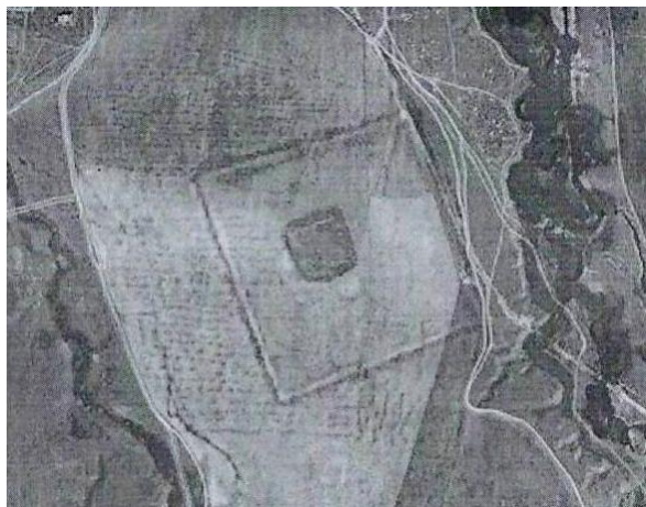
Фото 10. Торткуль (городище) Жаксылык.

Очевидно, это поселение служило пунктом временной остановки для проходящих транзитных и внутренних торговых караванов, идущих по равнинной территории долины реки Или, между этими городищами. В то время Капчагайского водохранилища не было и уровень воды в реке Или был не высоким, что позволяло караванам свободно переходить её в мелководных местах.