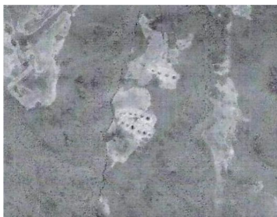
Фото 3. Поселение № 4.

- среди песков пустыни Сарыесик-Атырау поселение № 4 состоящее из 16 землянок (Фото 3, географические координаты 45°26'57"N, 76°10'01"E), поселение № 5 состоящее из 260 землянок (Фото 4, географические координаты 44°59'06"N, 76°33'51"E), поселение № 6 состоящее из 68 землянок (Фото 5, географические координаты 45°12'32"N, 77°27'30"E);