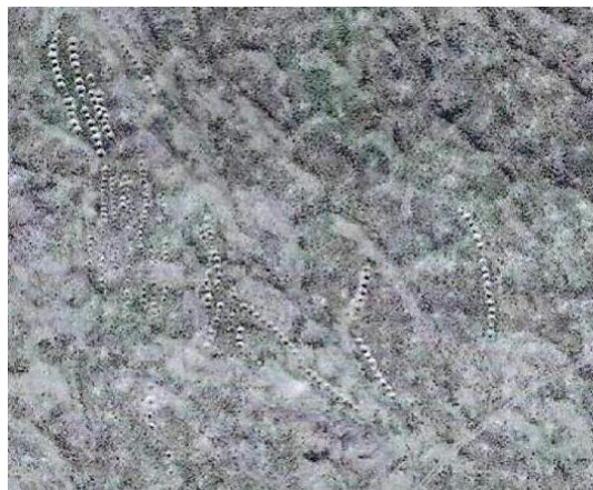
Фото 4. Поселение № 5.