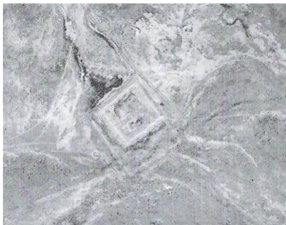
Фото 15. Древнее городище Актам.

Городище Актам представляет собой двойное квадратное сооружение. Первоначально в тюрские времена в начале VIII века оно представляло собой площадку размером 250x300 метров, ориентированной по сторонам света и укрепленной небольшим валом, оплывшим на сегодняшний день. Тюрками оно, очевидно, использовалось как земледельческое поселение и использовалось для временной стоянки проходящих торговых караванов описываемого ответвления. После прихода огузов, на его месте было построено новое сооружение – городище-крепость, служившее еще для защиты от набегов враждующих кимакских племен (Фото 15, географические координаты 45°32'29"N, 75°46'30"E). Площадь вновь построенной крепости имела размеры 180x170 метров и была укреплена саманными стенами в виде вала с башнями, которая сейчас разрушенная и оплывшая. В 1961 г. исследования вновь построенного городища проводилось Семиреченской археологической экспедицией под руководством академиком К.А.Акишева, К.М. Байпакова, а в 1997 г. Южно-Казахстанской комплексной археологической экспедицией под руководством академика К.М. Байпакова [7]. В ходе раскопок было обнаружено несколько десятков осколков керамической посуды, бронзовых и стеклянных изделий датируемых X-XII вв., принадлежащих проживающим огузам.