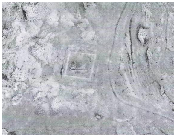
Фото 16. Древнее городище Агашаяк.

Из городища Актам путь дальше шел между руслами протоков долины реки Или, песчаных барханов и ирригационных полей к городищу Агашаяк , которое находилось в 45 км (Фото 16, географические координаты 45°54'27"N, 75°39'44"E). Его планировка имеет большое сходство с городищем Актам. Первоначально в тюрское время, городище Агашаяк , очевидно, представляло собой квадратное в плане сооружение, размером 350x350 метров, огражденное небольшим валом. С приходом