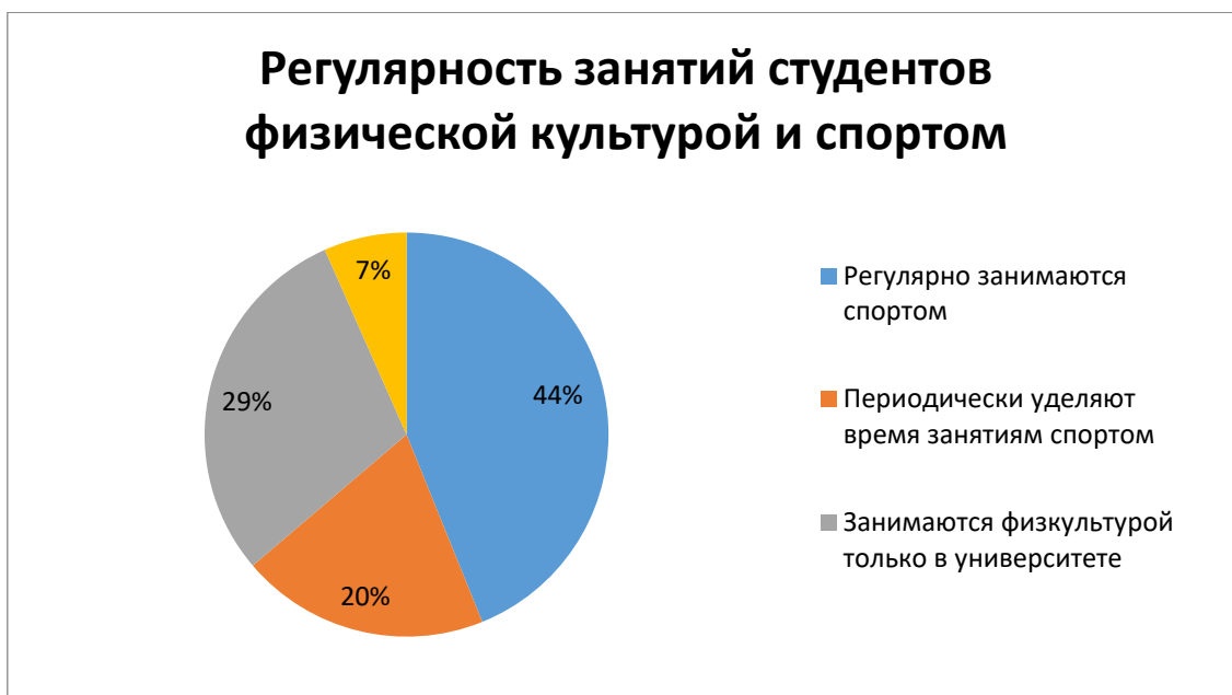
Диаграмма 1. Регулярность занятий студентов физической культурой и спортом.

данный момент времени» [2, с. 65] юношам необходимо было ответить на вопрос: «Как часто Вы занимаетесь физической культурой и спортом»? Ответы представлены на диаграмме 1.