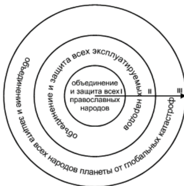
Рисунок 2. Системогенез русской идеи, где:

Графическое изображение трёх этапов эволюции русской идеи представлено на рисунке 2 и в таблицах 1 и 2.