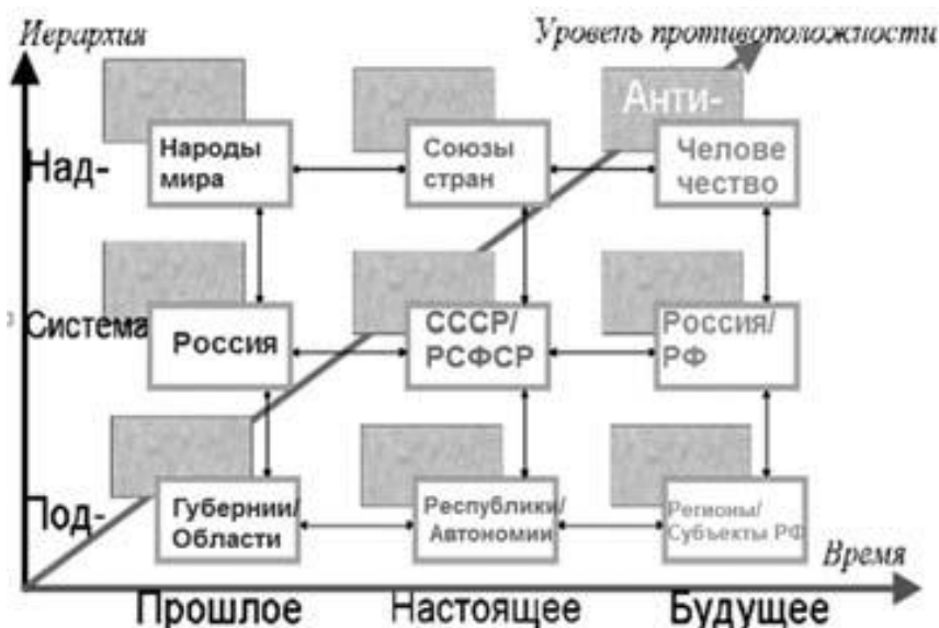
Рисунок 1. Хронопол русского мира

изобретательских задач (рисунок 1) [1, с. 39–40]. Русской идее всегда противостояла антисистема. Первой русской идее противостояли иноверные притеснители православия как вне, так и внутри страны. Второй русской идее противостояли сторонники несправедливого устройства мира. Третьей русской идее противостоят виновники глобальных катастроф: экологических, техногенных, социальных и антропологических. Тем не менее, русская идея как миссия России в мире, несмотря на исторические противодействия её реализации во всей полноте со стороны антисистемы, существует объективно, как потенциально, так и актуально.