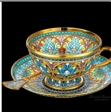
Чайная пара. Витражная эмаль. Фирма Е.Бутенко